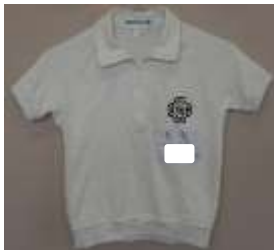
規定の半袖シャツ