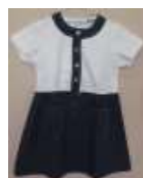
← 規定のワンピース