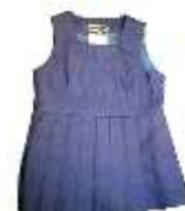
ジャンパースカート