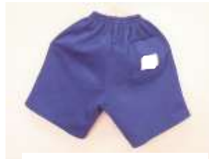
トレーニングパンツ