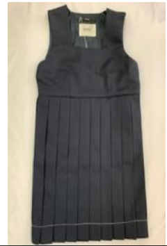
ジャンバースカート